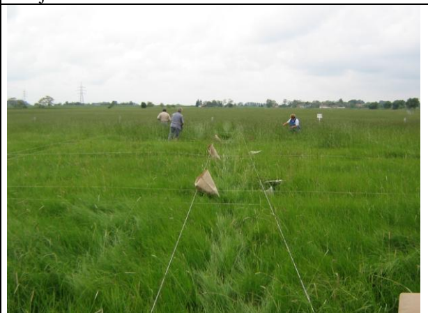
Növénymintavétel a trágyázási kísérletben