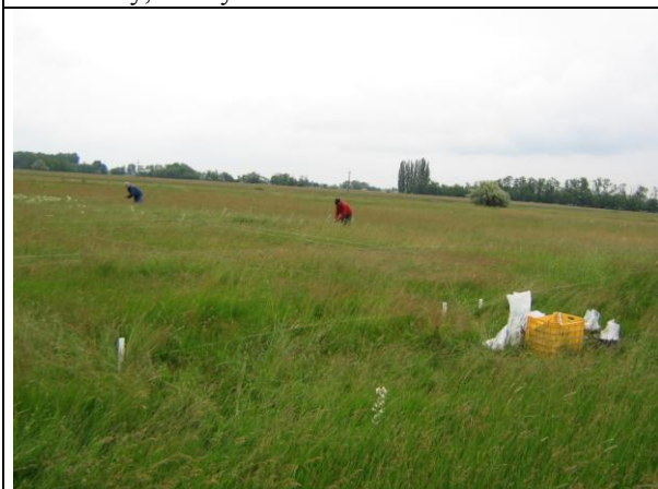
Növénymintavétel a trágyázási kísérletben