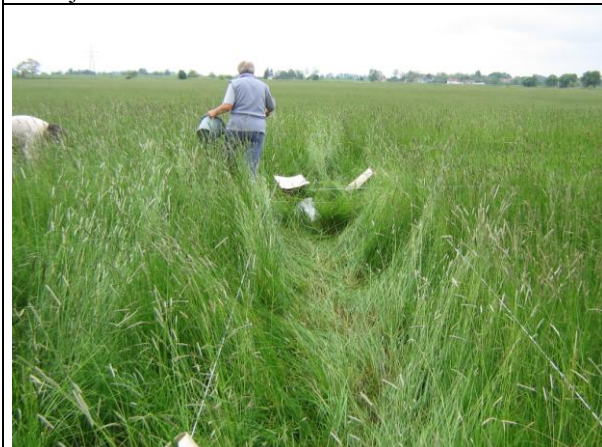
Növénymintavétel a trágyázási kísérletben