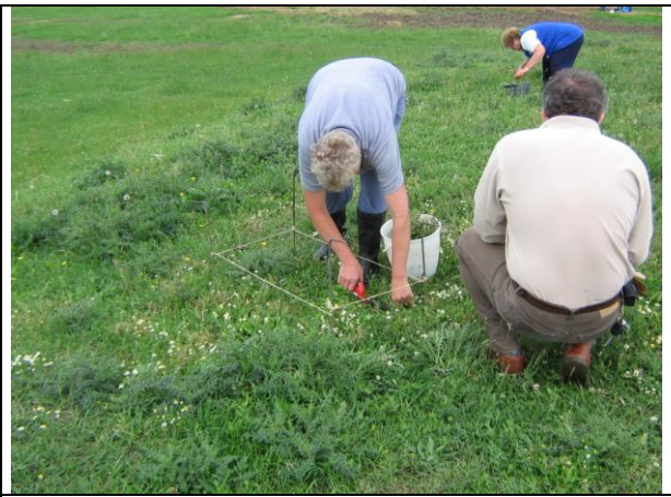
Növénymintavétel a pihenődombon