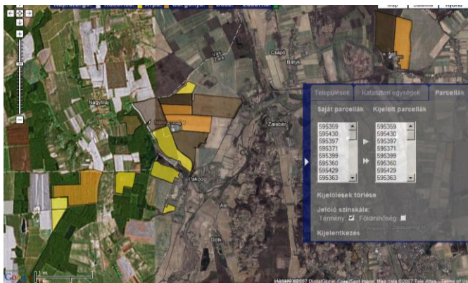
3. ábra A D-e-Meter rendszer felhasználói felülete