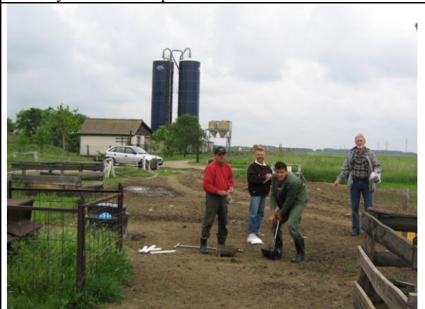
Talajmintavétel az itatónál